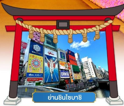
ย่านชินไซบาชิ